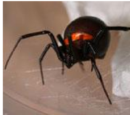
Latrodectus menavodi