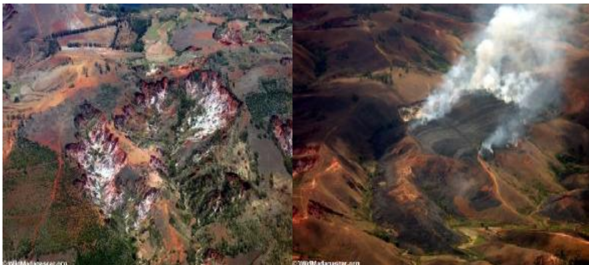
Letecké snímky eroze lavaka a vypalování lesa (tavy).