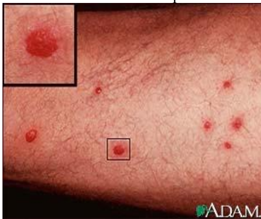
Vyrážka v místě proniknutí cercárie do kůže

Hlavní prevencí je vyvarovat se styku s kontaminovanou vodou. Velmi nebezpečná je voda rýžových polí a zavodňovacích struh. Stojatá voda je nebezpečnější než tekoucí. Z léčiv se používá praziquantel, amiquin a metrifonát, které stojí čtvrtinu dolaru denně a pro chudé obyvatele tropických států jsou nedostupné. V dnešní době je zkoušen krém, který se bude natírat na kůži a bude stát půl centu denně.