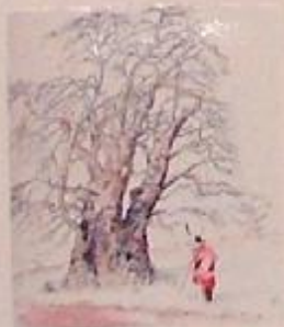
Studna na vodu vyhloubená v baobabu

Květ Adansonia rubrostipa je opylován lišají