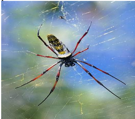
Nephila madagascariensis

Latrodectus mactans menavodi (snovačka jedovatá) – Nejznámější ze všech jedovatých pavouků, vyskytuje se po celém světě v několika poddruzích. Má mnoho místních názvů, nejvíce používaný název je black widow (černá vdova). Malgašové ji nazývají vancho. Samice dorůstá velikosti 30 – 35 mm, samec je mnohem menší. Kousnutí je smrtelné asi v 9% případů. Jedová žláza obsahuje 0,3 – 0,5 mg žlutě zbarveného jedu, který působí jako neurotoxin. Samice kousne většinou, když střeží kokon s vajíčky, který je zavěšen na pavučině.