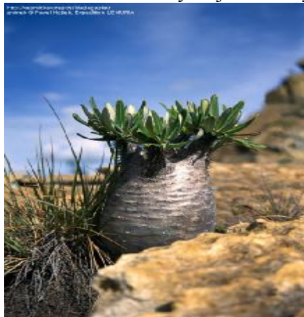
Pachypodium rosulatum var. gracilius

Zásobním orgánem je kořenová hlíza, ze které v období dešťů vyrostou popínavá liána, vykvete a opět zaschne. Kaudiciformní sukulenty mají zásobní stonk i kořen, ztlustá část se nazývá kaudex. Charakteristickými jsou druhy rodu Adenia .